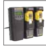
与 MicroDock II 兼容